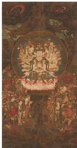
重文 千手観音二十八部衆像 (武曾横山・大清寺)