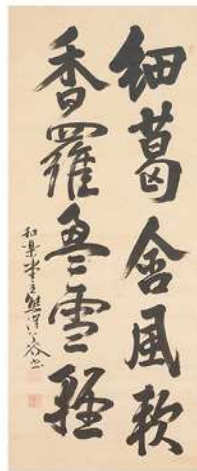
熊沢蕃山書跡 (琵琶湖文化館)