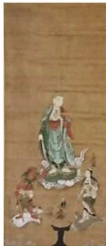
市指定 地蔵十王図