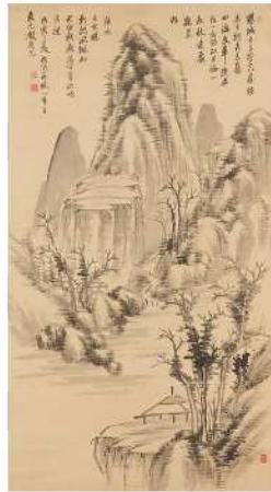
山水図 頼山陽筆 (琵琶湖文化館)