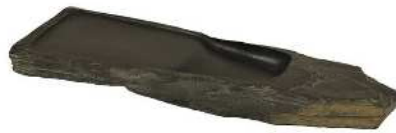
高島碗 (琵琶湖文化館)