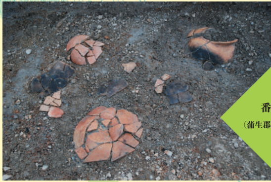
番場遺跡 (蒲生郡日野町三十坪)