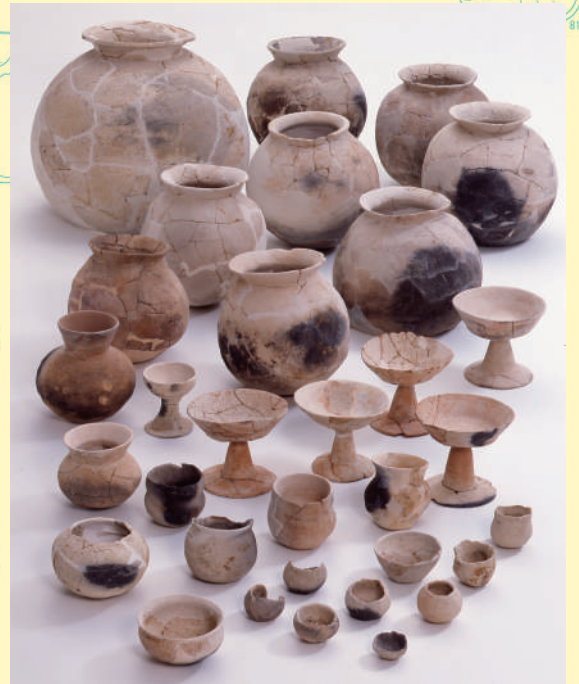
落込みから出土した土器 (滋賀県蔵)